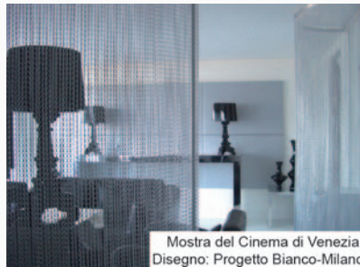
Mostra del Cinema di Venezia. Disegno: Progetto Bianco-Milano

Si può creare una tenda completamente liscia oppure si possono combinare colori, logotipi, disegni, forme geometriche, riproduzioni di opere d'arte e molto altro ancora.